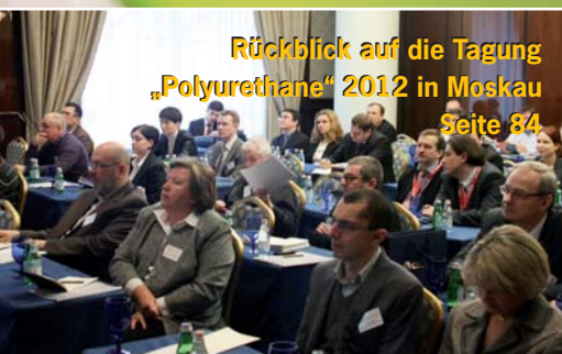
Rückblick auf die Tagung „Polyurethane“ 2012 in Moskau Seite 84