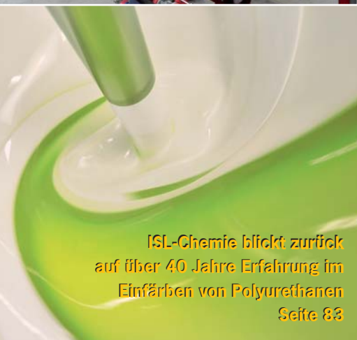
ISL-Chemie blickt zurück auf über 40 Jahre Erfahrung im Einfärben von Polyurethanen Seite 83