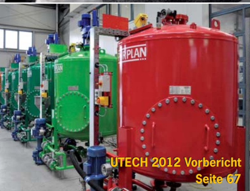
UTECH 2012 Vorbericht Seite 67