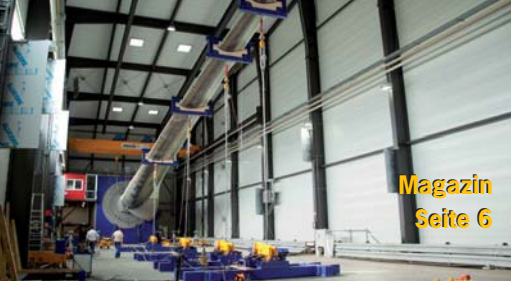
Magazin Seite 6