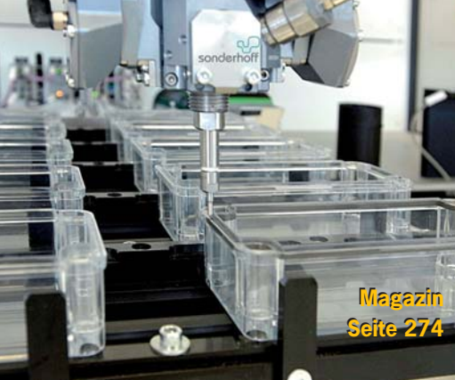
Magazin Seite 274