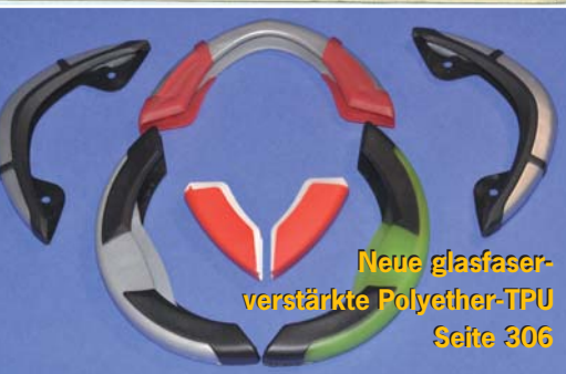
Neue glasfaser- verstärkte Polyether-TPU Seite 306