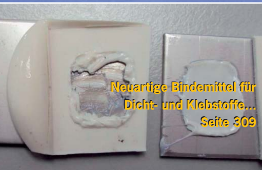
Neuartige Bindemittel für Dicht- und Klebstoffe... Seite 309